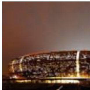
Soccer City Stadium Johannesburg (Afrique du sud) 2009