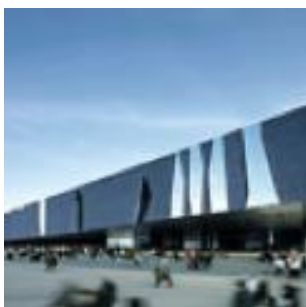
Forum des cultures, Barcelone, Espagne. Herzon & de Meuron