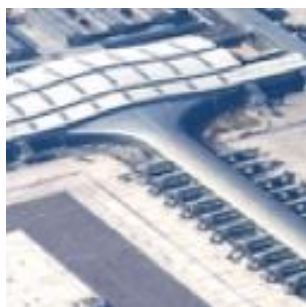
Barcelone Airport T1 (Espagne) 2008