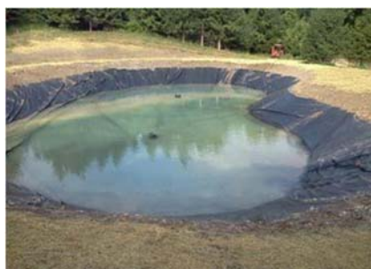
MITRĀJU, DĪŅU UN KANĀLU IEKLĀJUMS