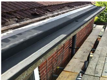
EPDM LOKSNES JUMTU HIDROIZOLĀCIJAI