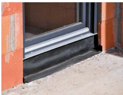
MŪRIS UN LOGU UZSTĀDĪŠANA

Var izmantot arī uz nedaudz nelīdzenām virsmām.