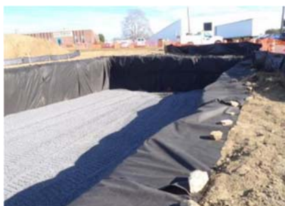
PAZEMES ŪDENS PĀRVALDĪBA